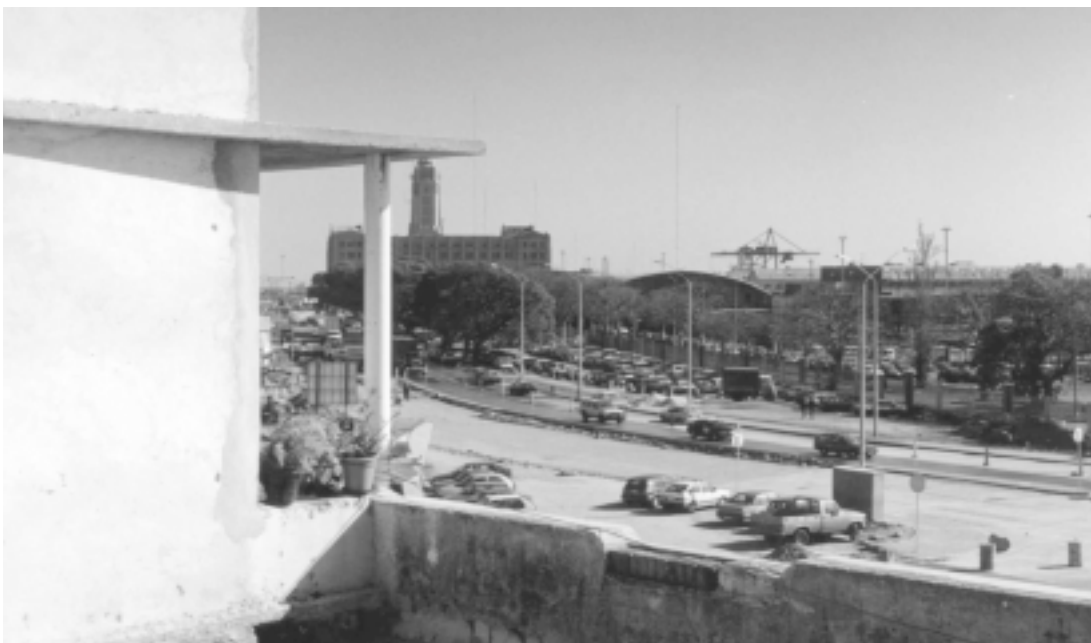
IMAGEN 10: PUERTO COVICIVI, EL PUERTO DE MONTEVIDEO, VISTO DESDE EL ÚLTIMO PISO DEL RECICLAJE COVICIVI.

1982 por la IMM, con la creación de la Comisión Especial Permanente de la Ciudad Vieja, la realización del primer inventario y del primer catálogo de bienes protegidos, con la correspondiente normativa de protección.