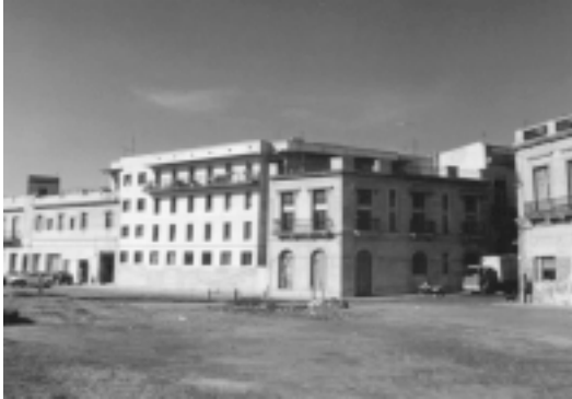
IMAGEN 8: VISTA GENERAL DEL RECICLAJE COVICIVI, FRENTE A LA RAMBLA PORTUARIA, EN LA CIUDAD VIEJA DE MONTEVIDEO.