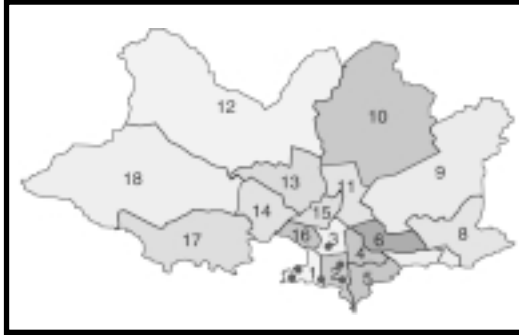
LOS 18 CENTROS COMUNALES ZONALES DEL DEPARTAMENTO DE MONTEVIDEO Y LA LOCALIZACIÓN DEL LOS RECICLAJES DEL PROGRAMA PILOTO DE RECICLAJE

En Montevideo se ha venido desarrollando en las últimas décadas, un proceso de expansión horizontal hacia la periferia y su área metropolitana, que sumado al estancamiento demográfico que caracteriza a la población uruguaya, ha provocado un descenso de la densidad media de la ciudad y una importante degradación en las áreas centrales, acompañadas de una subutilización de sus infraestructuras y servicios.