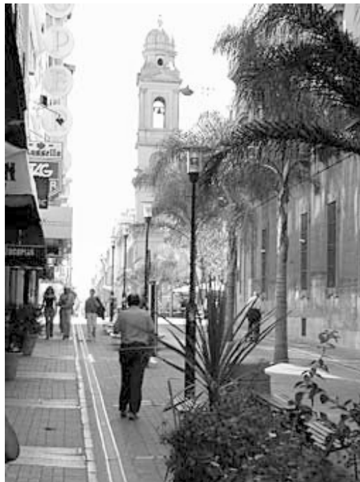
IMAGEN 12: PEATONALCATEDRAL, VISTA ACTUAL DE LA PEATONAL SARANDÍ, EN LA CIUDAD VIEJA. AL FONDO, LA CATEDRAL METROPOLITANA

Así mismo, las tres instituciones involucradas acordaron poner a disposición del Convenio todas las herramientas y recursos que están a su alcance, para cumplir con los objetivos planteados, priorizando dentro de sus inversiones aquellas a desarrollar en Ciudad Vieja. Para ello se comprometen a realizar las acciones institucionales necesarias para designar y financiar los costos de una estructura de coordinación y gestión mínima, conformada por un Consejo Directivo y una Secretaría Ejecutiva.