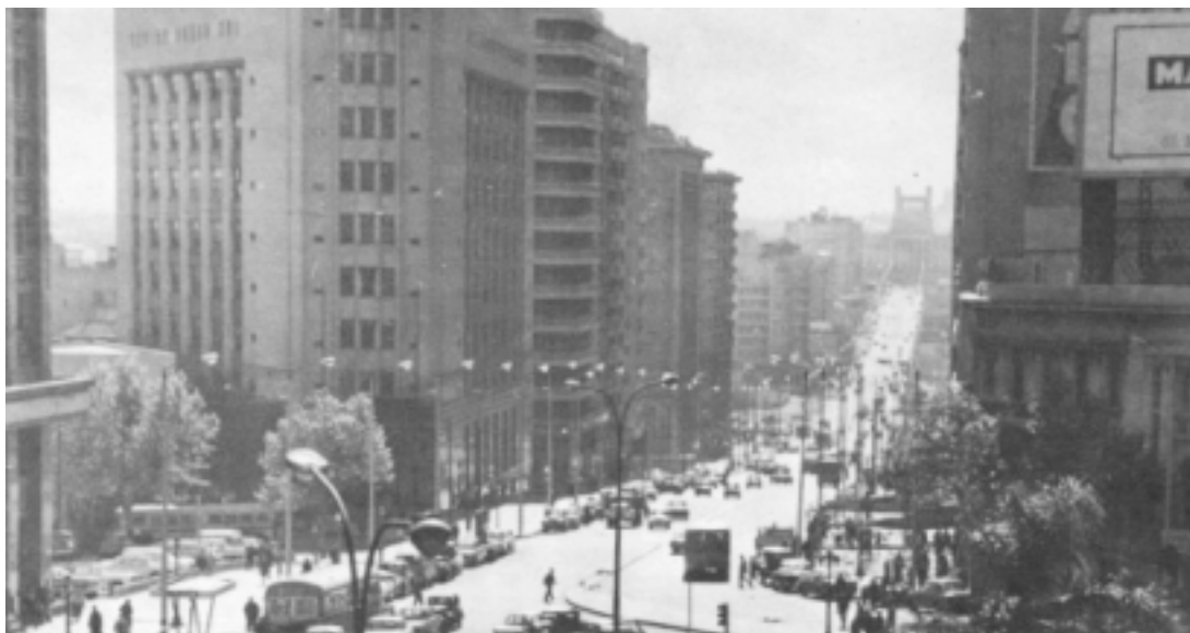
IMAGEN 1: VISTA DE LA DIAGONAL AGRACIADA, REALIZADA A PARTIR DEL PLAN FABINI DE 1928.

conformaban el área central a mediados del siglo XIX, a un Montevideo que seis décadas después ocupaba una superficie inscrita en un sector de círculo de radio superior a los 10 kilómetros. Simultáneamente el número de construcciones de Montevideo se multiplicó por casi siete. ▶ 1