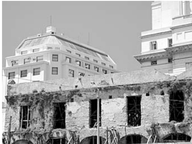
IMAGEN 5: DEGRADACIÓN, LA SITUACIÓN DE DEGRADACIÓN EN LA CIUDAD VIEJA DE MONTEVIDEO.