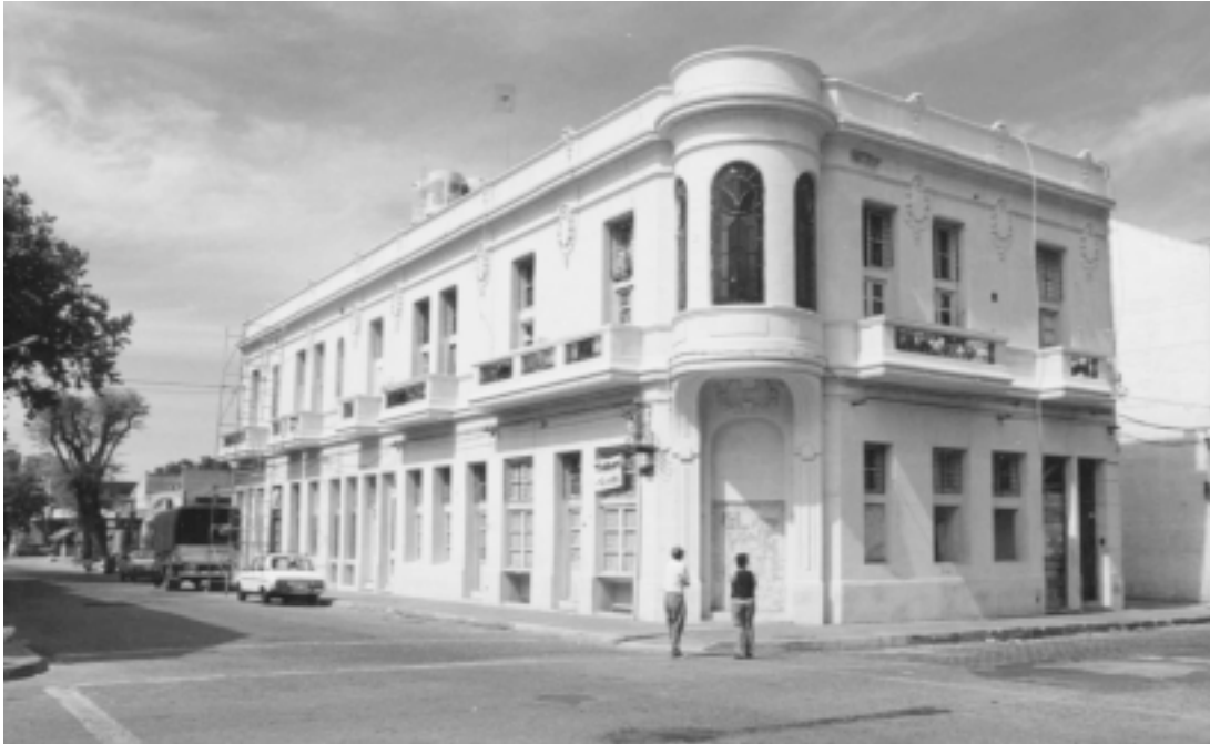
IMAGEN 7: VISTA GENERAL DEL RECILCAJE COVIGOES, EN EL BARRIO GOES.

En principio la IMM seleccionó tres grupos que se organizaron para reciclar viviendas: MUJEFA, PRETYL y COVIGOES I (Matriz). Para esta selección se utilizaron criterios sociales que adjudicaron puntajes y porcentajes: 70% “parte grupal”; 30% parte socio-económica individual.