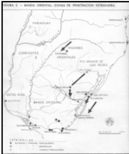
IMAGEN 1: MAPA DE LA BANDA ORIENTAL EN LA ÉPOCA DE LA COLONIA. DEL LIBRE "FUNDACIÓN DE POBLADOS EN EL URUGUAY" – ÁLVAREZ LENZI, RICARDO - INSTITUTO DE HISTORIA DE LA ARQUITECTURA – FACULTAD DE ARQUITECTURA – UNIVERSIDAD DE LA REPÚBLICA DEL URUGUAY – MONTEVIDEO, 1972.

El tipo de estructura urbana siguió las directrices de las Leyes de Indias: "ciudad territorio". El núcleo urbano propiamente dicho o "solares del pueblo" se estructura en base a un damero uniforme de manzanas separadas por calles trazadas a "cordel y regla", orientadas a "medios rumbos", haciendo caso omiso de las particularidades topográficas del lugar de implantación.