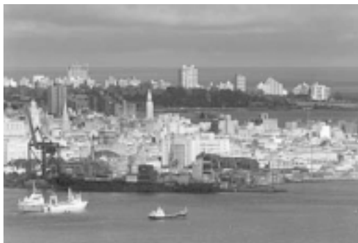
IMAGEN 11: FOTO DE LA BAHÍA DE MONTEVIDEO

El Programa de Apoyo y Formación Laboral de Ciudad Vieja Renueva ha impulsado conversaciones con empresarios de la zona para promover la inserción, en empleos safrales o permanentes, de vecinos desempleados del barrio.