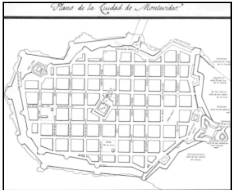
IMAGEN 2: AMANZANADO CV, PLANO DE LA CIUDAD VIEJA Y SUS MURALLAS, EN LA ÉPOCA COLONIAL.

Es pues en la península, donde se implantó la ciudad primitiva, lo que en el futuro habría de denominarse Ciudad Vieja : un puñado de manzanas cercadas por la línea costera, las murallas de la ciudadela y las cortinas defensivas que la separaban de su territorio