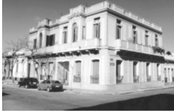
IMAGEN 9: VISTA GENERAL DEL RECICLAJE PRETYL, EN EL BARRIO PALERMO.

Los resultados de este programa y sus procesos, por su escala y por el hecho de que no existió interrelación entre ellas, no contribuyeron cuantitativamente a la rehabilitación urbana de las áreas centrales. No obstante, sí aportaron a la rehabilitación edilicia y barrial, al recuperar edificaciones con alto grado de deterioro y en general turgurizadas u ocupadas ilegalmente. Asimismo contribuyeron a la rehabilitación social de la población que participó de las mismas, debido a que la experiencia les mejoró su autoestima y les dio mayor estabilidad. En síntesis, los aspectos más positivos del PPR se pueden resumir en que: