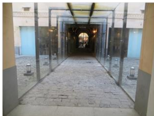
Museo del Holocausto, Buenos Aires, Argentina.