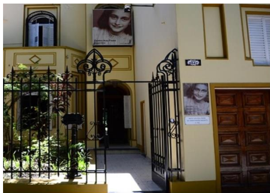
Centro Ana Frank, Buenos Aires, Argentina